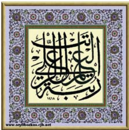
„Wissenschaft ist die höchste Auszeichnung“

„Die Religion ist leicht auszuführen, und keiner kann in ihr streng sein, ohne dass sie ihn besiegt. Darum seid recht geleitet,