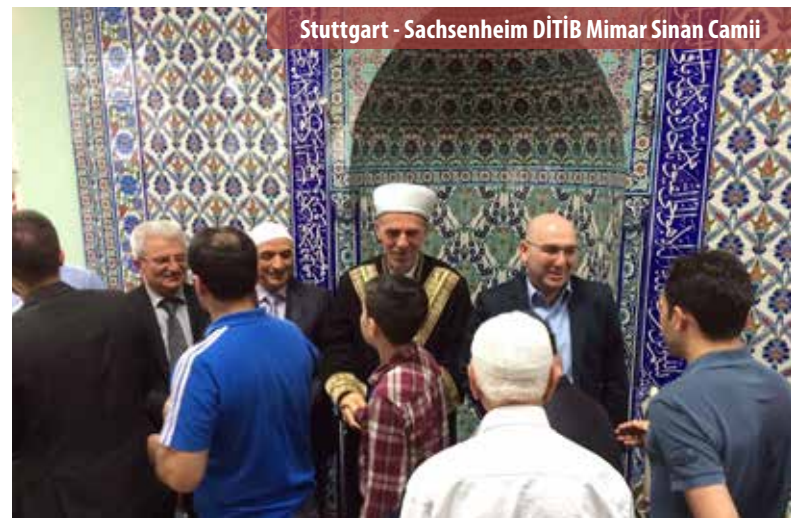
Stuttgart - Sachsenheim DİTİB Mimar Sinan Camii