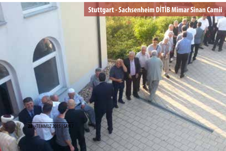
Stuttgart - Sachsenheim DİTİB Mimar Sinan Camii

Ayrıca Almanya genelinde faaliyet gösteren Diyanet İşleri Türk İslam Birliği (DİTİB) derneklerinde de bayram namazı sonrasında cemaatle bayramlaşma programları tertip edildi.