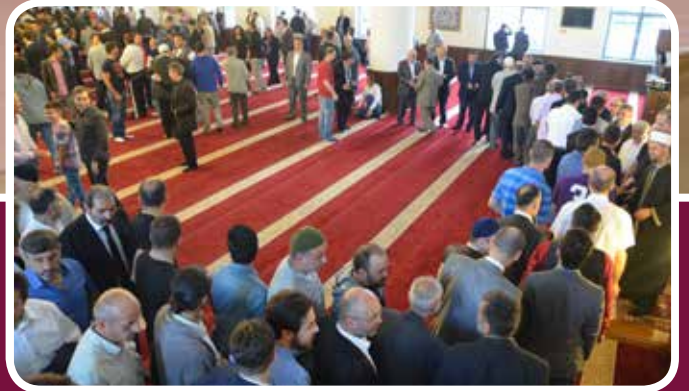
DİTİB derneklerinde Ramazan bayramı coşkusu