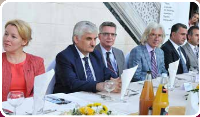
İçişleri Bakanı Thomas de Maizière Berlin DİTİB Eyalet Birliği iftarına katıldı