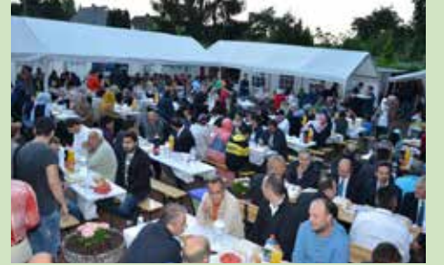
Hannover Eyüp Sultan