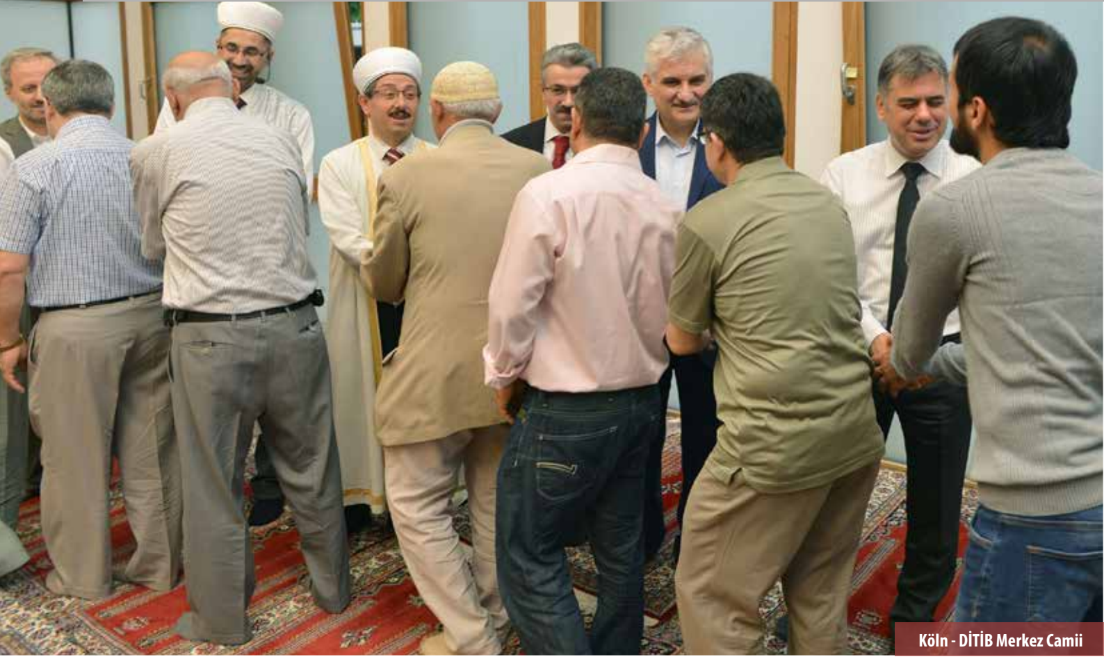
Köln - DİTİB Merkez Camii