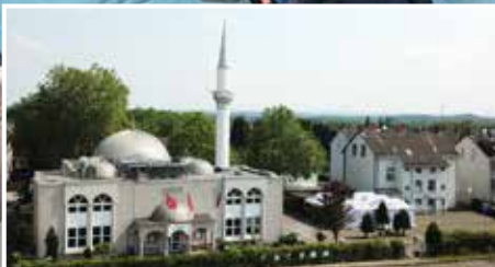
CAMİLERİMİZ | UNSERE MOSCHEEN: Gladbeck DİTİB Türkiye Camii Gladbeck DİTİB Türkiye Moschee ► S.6