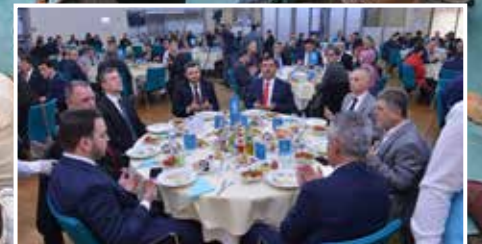
HABERLER | NACHRICHTEN: DİTİB'in iftar sofrası her kesimden insanı bir araya getirdi ► S.14