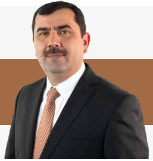
Kazım Türkmen DİTİB Genel Başkanı · DİTİB-Vorstandsvorsitzender

Rahman ve Rahim olan Allah'ın adıyla. · Im Namen Allahs, des Barmherzigen und Gnädigen.