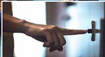
MİNBER'DEN SESLENİŞ | STIMME VON DER PREDIGTKANZEL: Misafire İkrâm ve Ziyaretleşme Gegenseitiges Besuchen ► S. 8